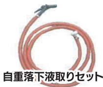
自重落下液取りセット